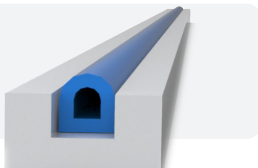
Dimensions recommandées pour la gorge Tolérance d'usinage : \pm 0,05